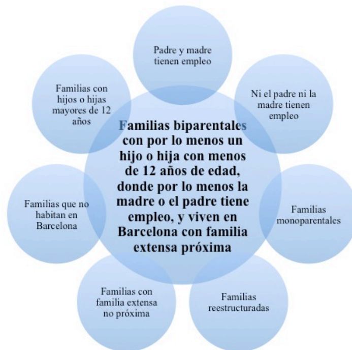
Figura 1: Unidad de análisis y grupos de comparación

La codificación de la información se realizó con el proceso de codificación abierta, codificación axial y conceptualización (Strauss & Corbi, 2008).