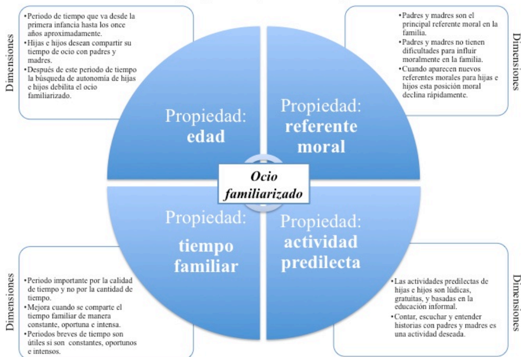
Figura 3: Ocio familiarizado : categoría central (propiedades y dimensiones)